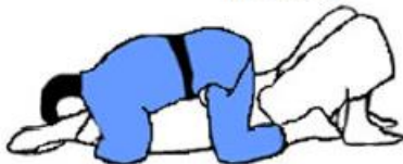
Position des pieds pour pontage