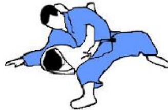
Variante de position des jambes