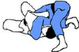
Variante de position des jambes